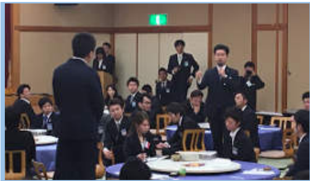
多少の猫背が気になりますが…こんな大勢の中で★堂々とした雰囲気です！！