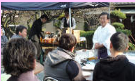
岩間先輩からお話を頂きました！ありがとうございました！