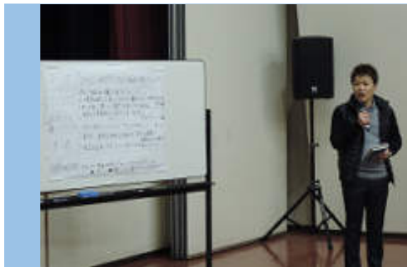
理事長からの「審査員講評」、いつも理事長は的確です！！