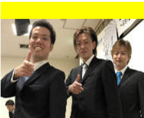
これから宜しくお願いします！