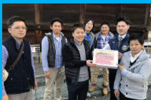
優勝はベテランチーム☆おめでとうございます！！良か肉★