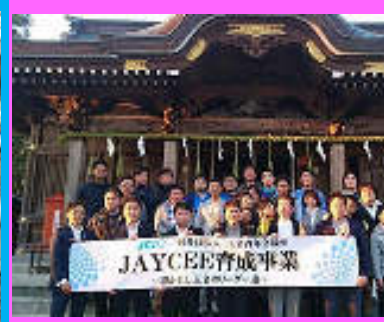
片付け・掃除までが事業です！お疲れ様でした！