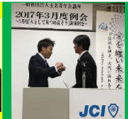
さすがに百戦錬磨の花火師・伊藤君も