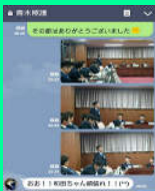
後のエピソードはさておき、青木会頭よりLINEが着てました！