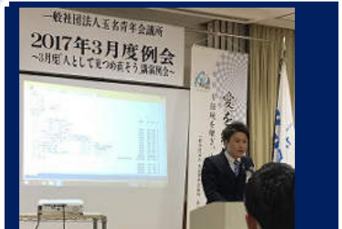
理事長から会員拡大30名以上、復興元年の年度になるとの挨拶