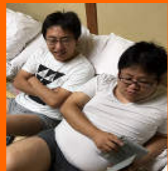
旅先では、こんな一面も見せてくれます(笑)