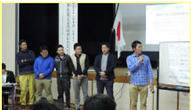
ここでも若手メンバーやオブザーバーの存在感がスゴかった！（笑）